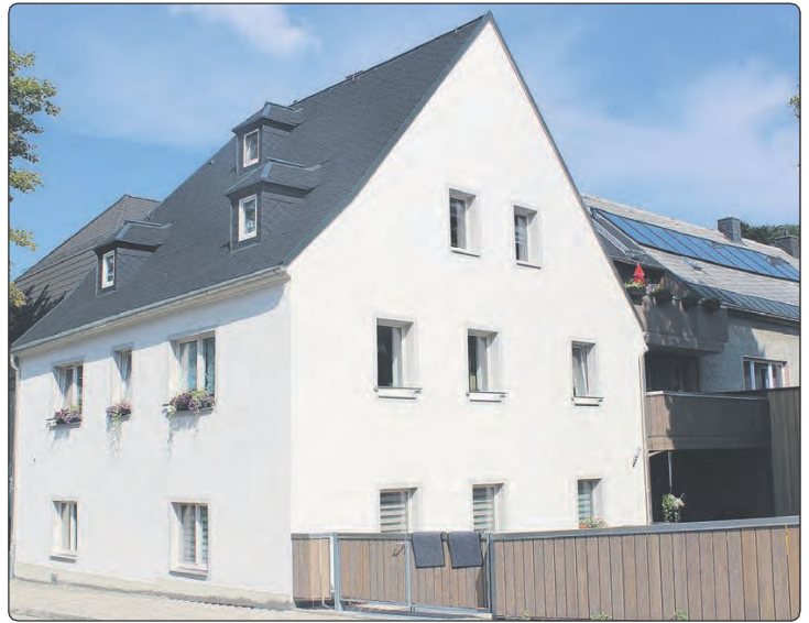
Das Gebäude Am Lindenhäuschen 4 in Marienberg wurde komplett saniert.

Bereits im Februar 2018 sind die ersten Mieter eingezogen, die wesentlichen Bauarbeiten an den Außenanlagen wurden dann im Frühjahr 2018 beendet. Die Arbeiten wurden fast ausschließlich von Handwerksbetrieben aus der Region (trotz der aktuellen Hochkonjunktur im Baugewerbe) termingerecht und in einer guten Qualität ausgeführt. In der Stadt Marienberg ist damit eines der letzten unsanierten Gebäude in neuem Glanz erstrahlt.