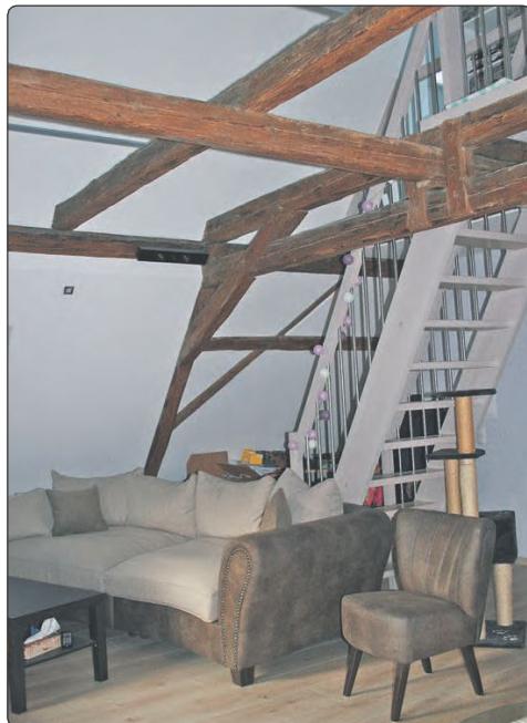
Die Wohnungen im Haus Am Lindenhäuschen 4 wurden stilvoll umgebaut, bieten den Mietern viel schicken Komfort.